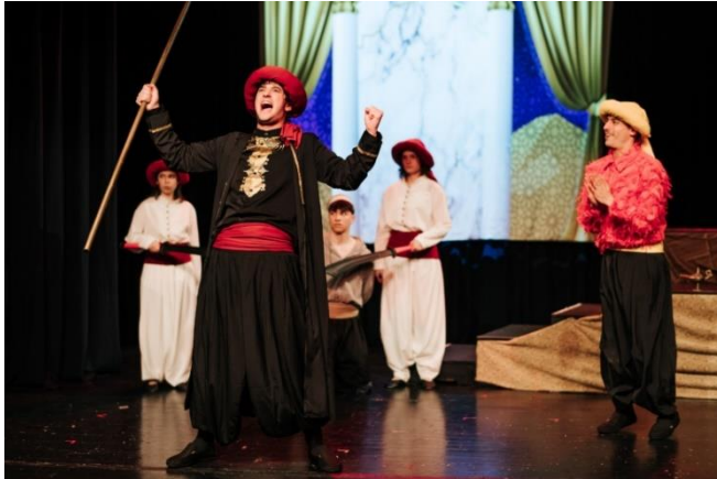
3Predstava Aladin (Loški oder)

Seveda pa najdemo tudi primere, kjer se da zgoraj napisano vendarle rešiti ali vsaj omiliti.